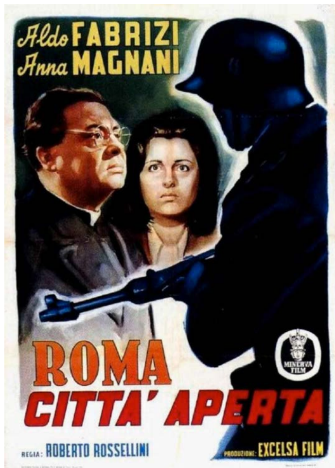
Cartell de Roma, ciutat oberta (1945), de Roberto Rossellini.

Observeu atentament el cartell següent de la pel·lícula Roma, ciutat oberta (1945), de Roberto Rossellini, i responeu a les qüestions 2.1, 2.2 i 2.3.