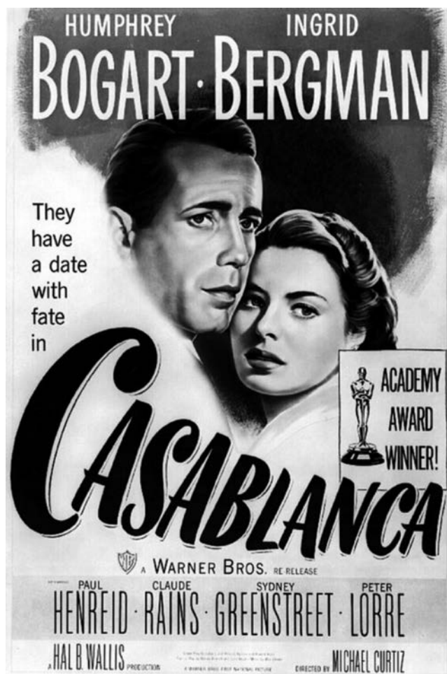
Cartell de Casablanca (1942), de Michael Curtiz.

Observeu atentament el cartell següent de la pel·lícula Casablanca (1942), de Michael Curtiz, i responeu a les qüestions 2.1, 2.2 i 2.3.